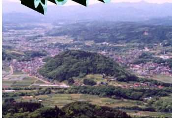
* 国道4号線側から見た城山公園全景

懐かしいふるさとの味を、神田で堪能してみませんか？ ふるさとの語りべのおはなしに耳を傾け、子どもの頃に想いを せ昭和のぬくもりを想いおこしてみませんか？ 心をリフレッシュする絶好の機会です。 地元三戸のおばちゃんたちが、お持て成します。